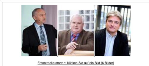
Fotostrecke starten: Klicken Sie auf ein Bild (6 Bilder)